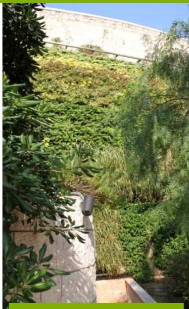
UN AN APRES - 2011