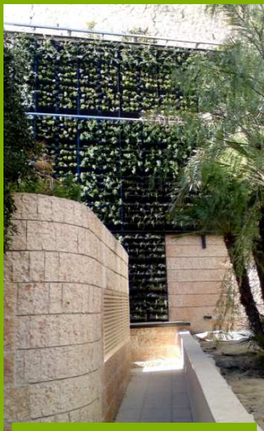
INSTALLATION - 2010